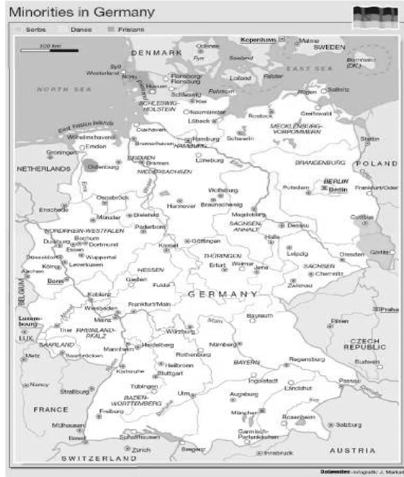
Harita: Almanya’da Azınlıklar

dan, azınlıkların geleneksel yerleşim yerlerinin bağlı olduğu eyalet anayasası ve yasaları geniş ölçüde ulusal azınlıklardan söz etmekte ve bunlara ilişkin hükümler içermektedir. Ayrıca 1990’daki Birleşme Anlaşması’yla da azınlıkların korunacağı teyit edilmiştir. 30